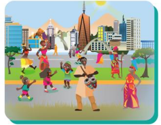
③ にんげんがすんでいるばしょ