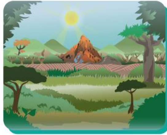
② やまとか、もりのなか